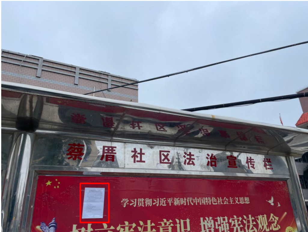
图 3.4 2024 年 5 月 23 日征求意见稿全文公示公告的现场粘贴