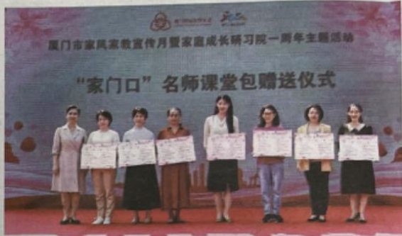
名师课堂到身边 营造家庭成长良好氛围