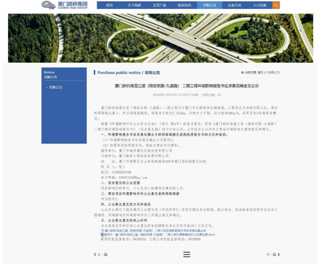
图 3.1 2024 年 5 月 23 日征求意见稿全文的网络公示

根据《办法》要求，建设单位于 2024 年 5 月 23 日在厦门路桥建设集团有限公司网站（ https://www.xmlq.com.cn/Notice/detail/24103 ）进行《厦门新机场沿江道（翔安东路-九溪路）二期工程环境影响报告书（征求意见稿）》公示，详见图 3.1。